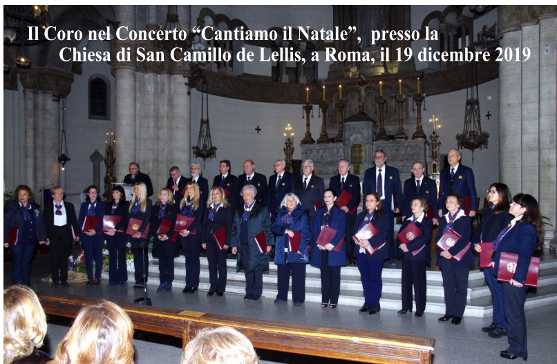
Il Coro nel Concerto "Cantiamo il Natale", presso la Chiesa di San Camillo de Lellis, a Roma, il 19 dicembre 2019

ampio. Ciò suggerisce che ascoltare musica può aiutare a concentrarci sul momento presente, ma cantare lo fa in modo più efficace. La ragione è intuitiva, visto che cantare in gruppo richiede