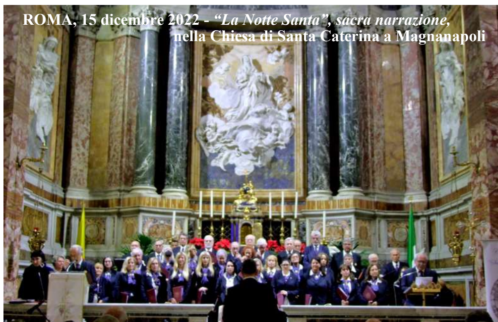
ROMA, 15 dicembre 2022 - "La Notte Santa", sacra narrazione, nella Chiesa di Santa Caterina a Magnanapoli