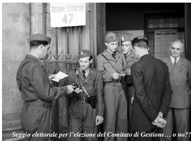
Seggio elettorale per l'elezione del Comitato di Gestione... o no?!

Poche, invece, le anticipazioni per l'avvenire in quanto, come espressamente dichiara-