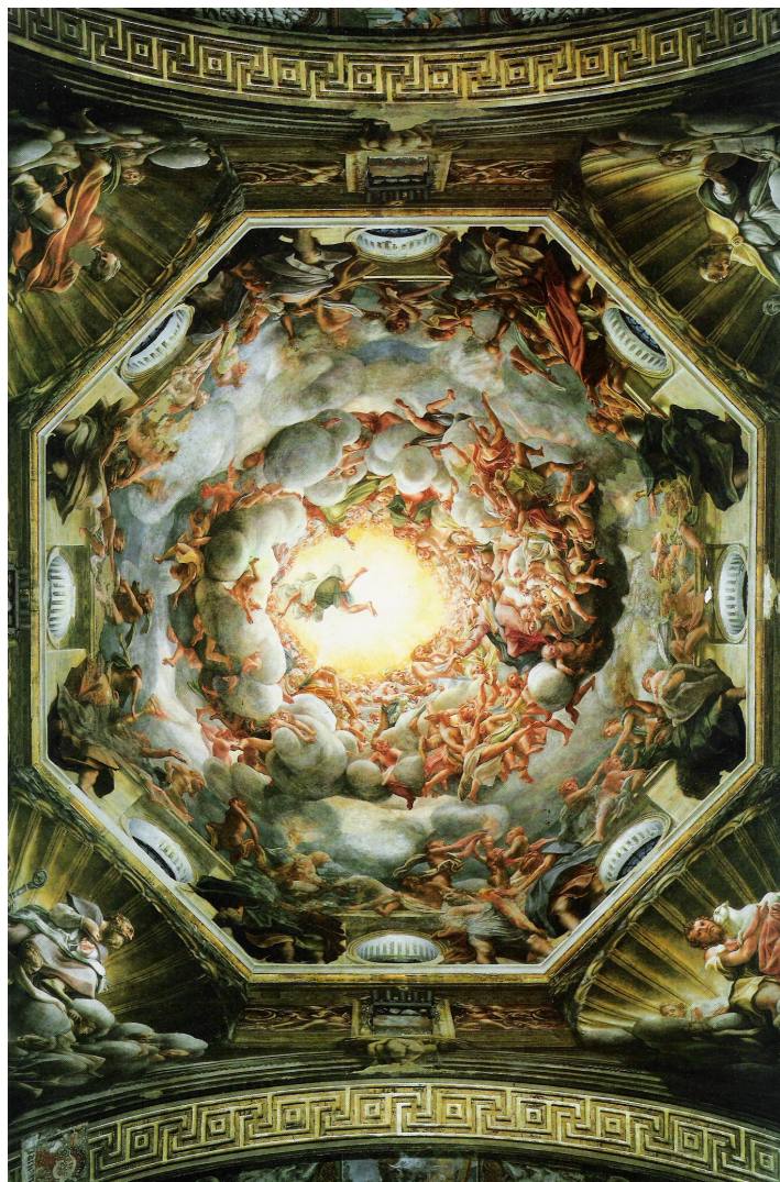
Antonio Allegri, il Caravaggio (1499 - 1534) -

Evoluzioni seguirono nei sec. XIV e XV con l'introduzione della pedaliera e la riscoverta (con meccanismi differenti utilizzati ancora oggi) della possibilità di dividere le sonorità con i registri. Le conseguenze furono le profonde variazioni