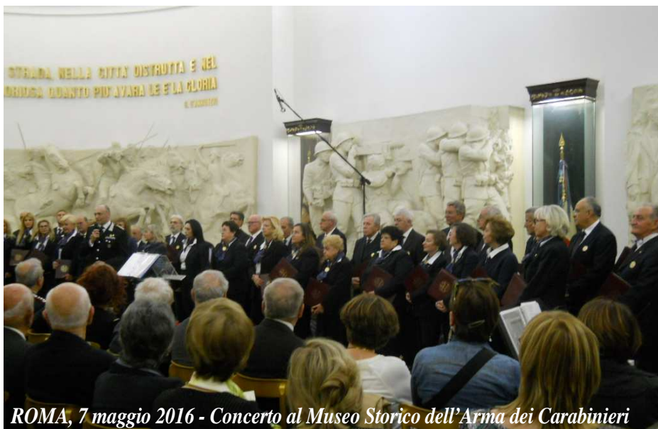
ROMA, 7 maggio 2016 - Concerto al Museo Storico dell'Arma dei Carabinieri

Solo imparando a usare correttamente la voce sarà possibile cominciare davvero ad ascoltarsi. Fino a percepire i suoni vocali e quelli silenziosi, ma non meno reali, gridati dal corpo. -Fine.