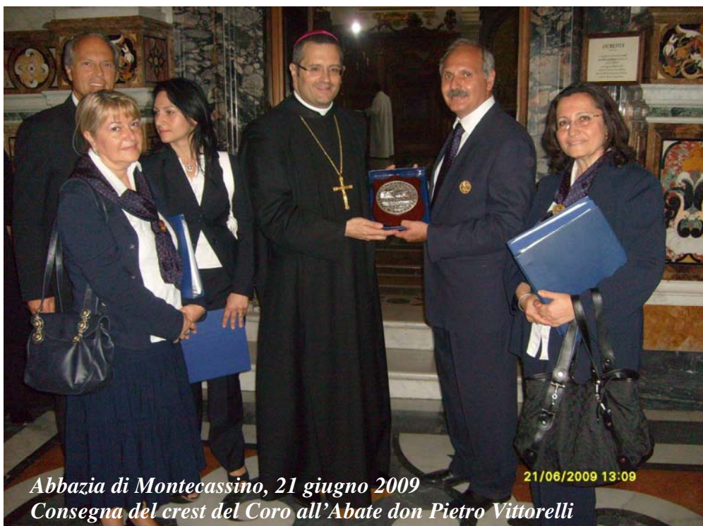
Abbazia di Montecassino, 21 giugno 2009