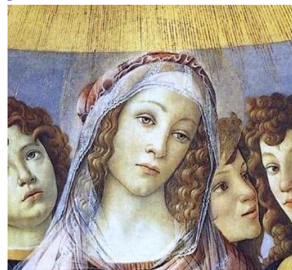
NELLA FOTO: Particolare della "Madonna della melagrana", dipinto del Botticelli (1487).

E Parte concorre tutta a rappresentare questa madre straordinaria, anche nel tema solenne dello splendore.